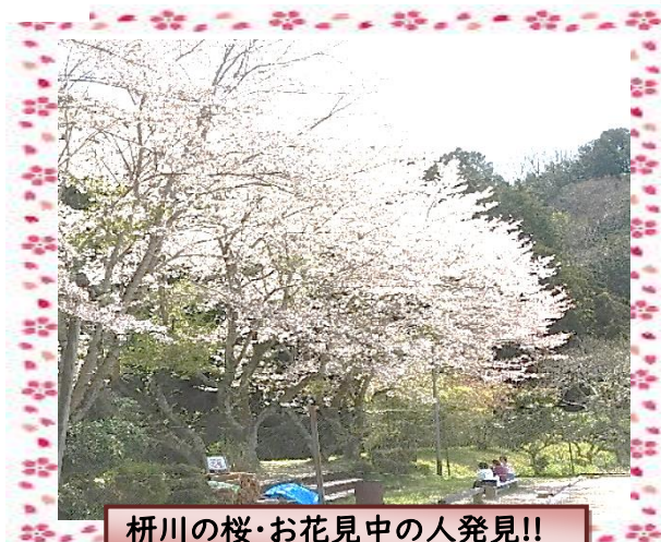
柘川の桜・お花見中の人発見!!