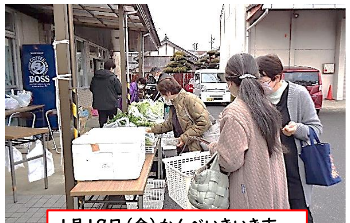
1月19日(金) かんべいきいき市