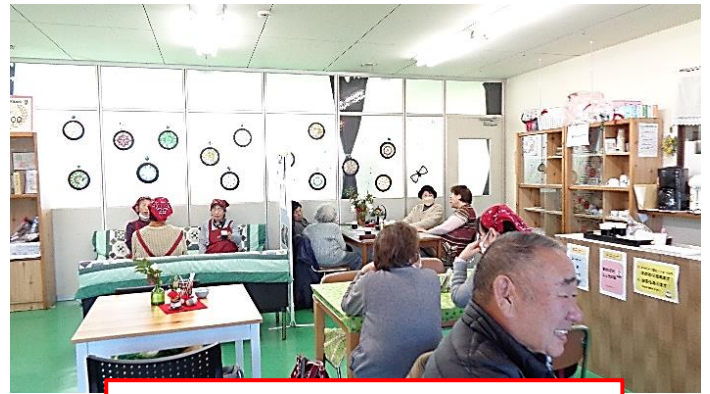
1月5日(金) かんべ陽だまりカフェ