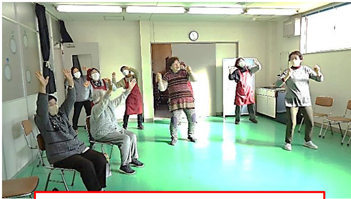
1月5日(金) 参加者による忍にん体操