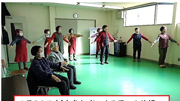
1月26日(金) 参加者による忍にん体操