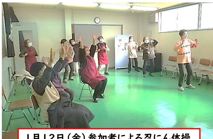
1月12日(金) 参加者による忍にん体操