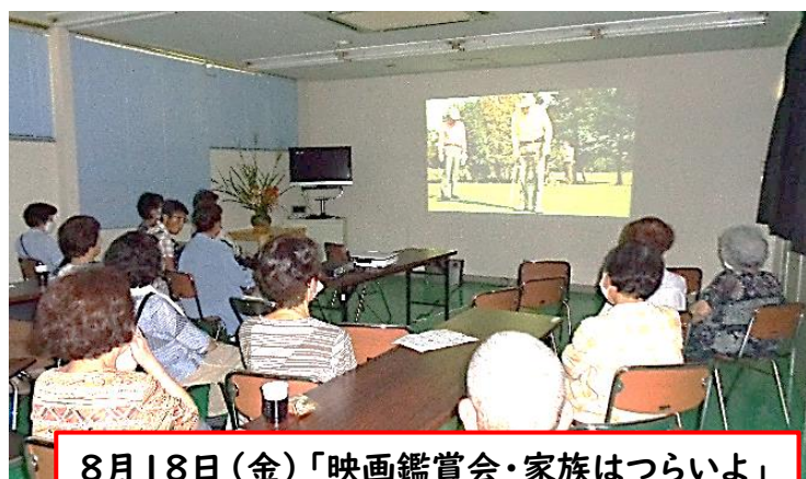
8月18日(金)「映画鑑賞会・家族はつらいよ」