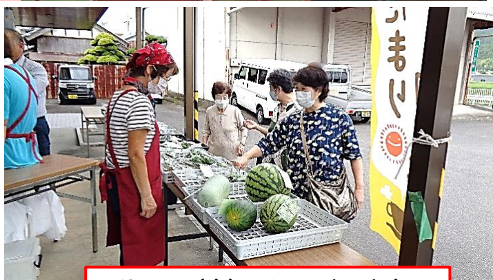
8月18日(金) かんべいきいき市