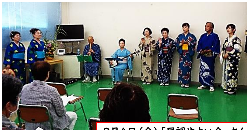
8月4日(金)「民謡やよい会」さんによる民謡・三味線・尺八・踊り