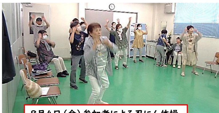
8月4日(金) 参加者による忍にん体操