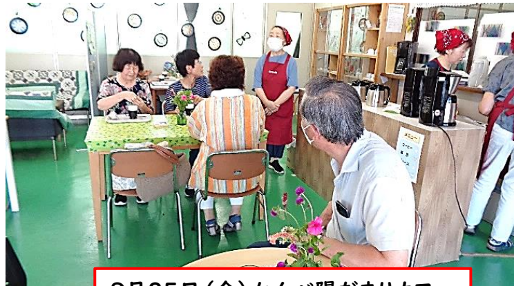
8月25日(金) かんべ陽だまりカフェ