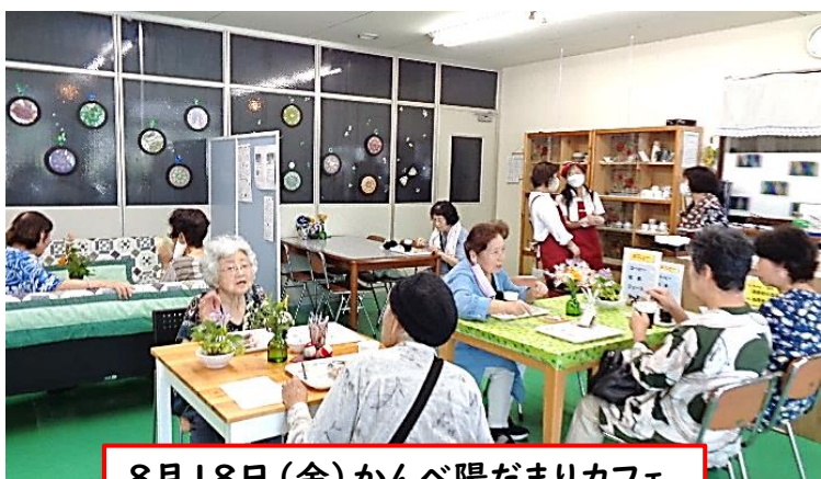
8月18日(金) かんべ陽だまりカフェ