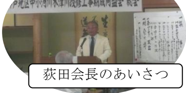
荻田会長のあいさつ