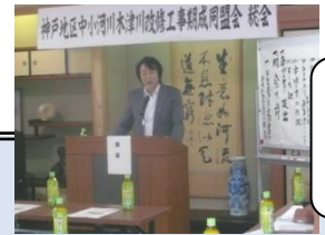
岡本市長 あいさつ