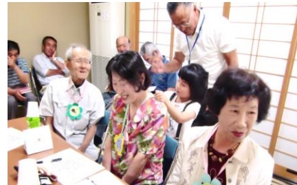
昨年度の「友愛のつどい」の様子