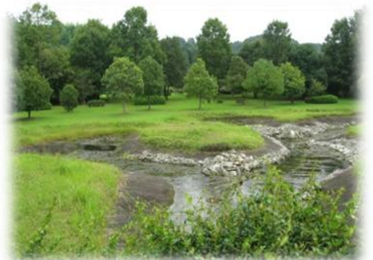
古代祭祀のにわ 城之越遺跡