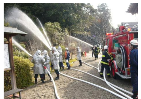
消防署・消防団による一斉放水訓練

去る1月22日(日)に文化財防火デー(1月26日)に伴い、古郡「常福寺」で、文化財を火災から守り、関係者の通報、初期消火等を目的とした消防訓練が実施されました。この日は、伊賀市南部防署・丸山分署、消防団、古郡地区住民による模型の文化財の搬出や初期訓練、一斉放水等の訓練を行っていました。