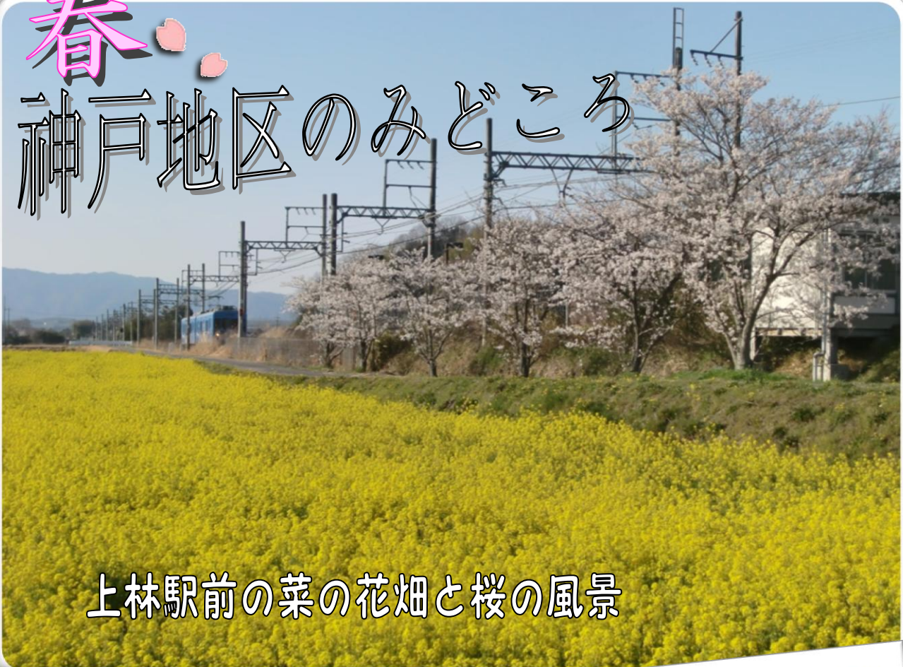
上林駅前の菜の花畑と桜の風景