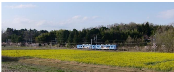
菜の花畑に沿って走る列車