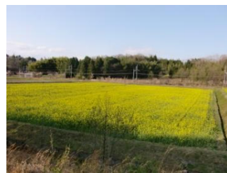
上林駅南側広域農道沿い転作