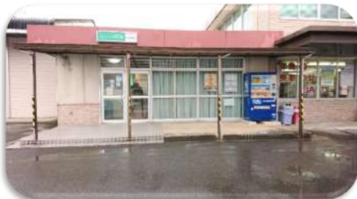
閉店となる「JA 神戸ふれあい店」